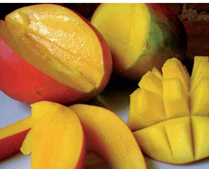
Ready to eat mango.

L'azienda Cupitur, in provincia di Messina, è attiva in agricoltura da oltre 200 anni. Ora produce con successo mango, lychee, avocado e, prossimamente, anche longan e carambola