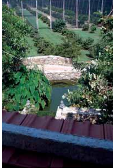
Cupitur farm. Azienda Cupitur.